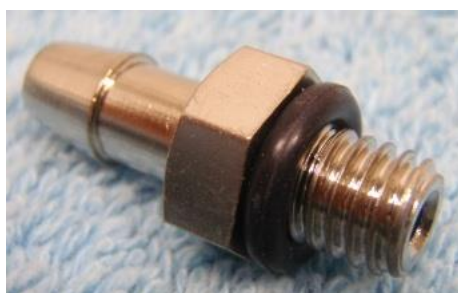
弊社標準ニップル