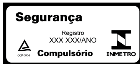
Figura 1: Selos de Identificação da Conformidade.