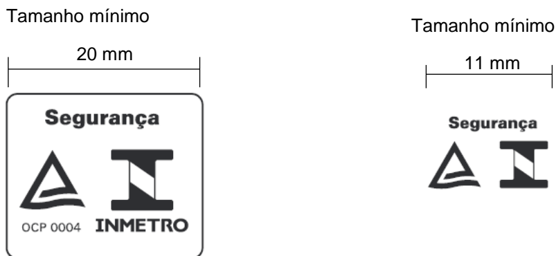
Figura 2 – Selo de Identificação da Conformidade compacto